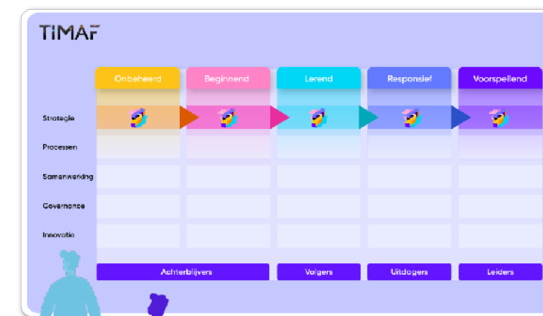
naar digitale Leider