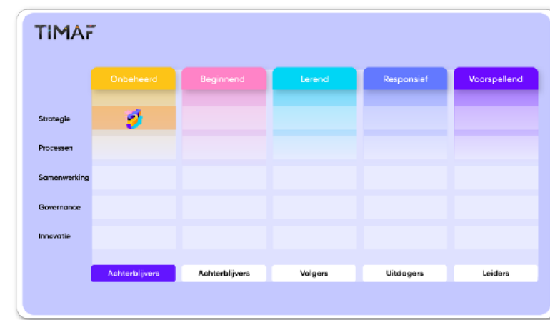
van digitale Achterblijver

Digitale achterblijvers die hun digitale volwassenheid niet weten verbeteren, verdwijnen vanzelf uit de markt.